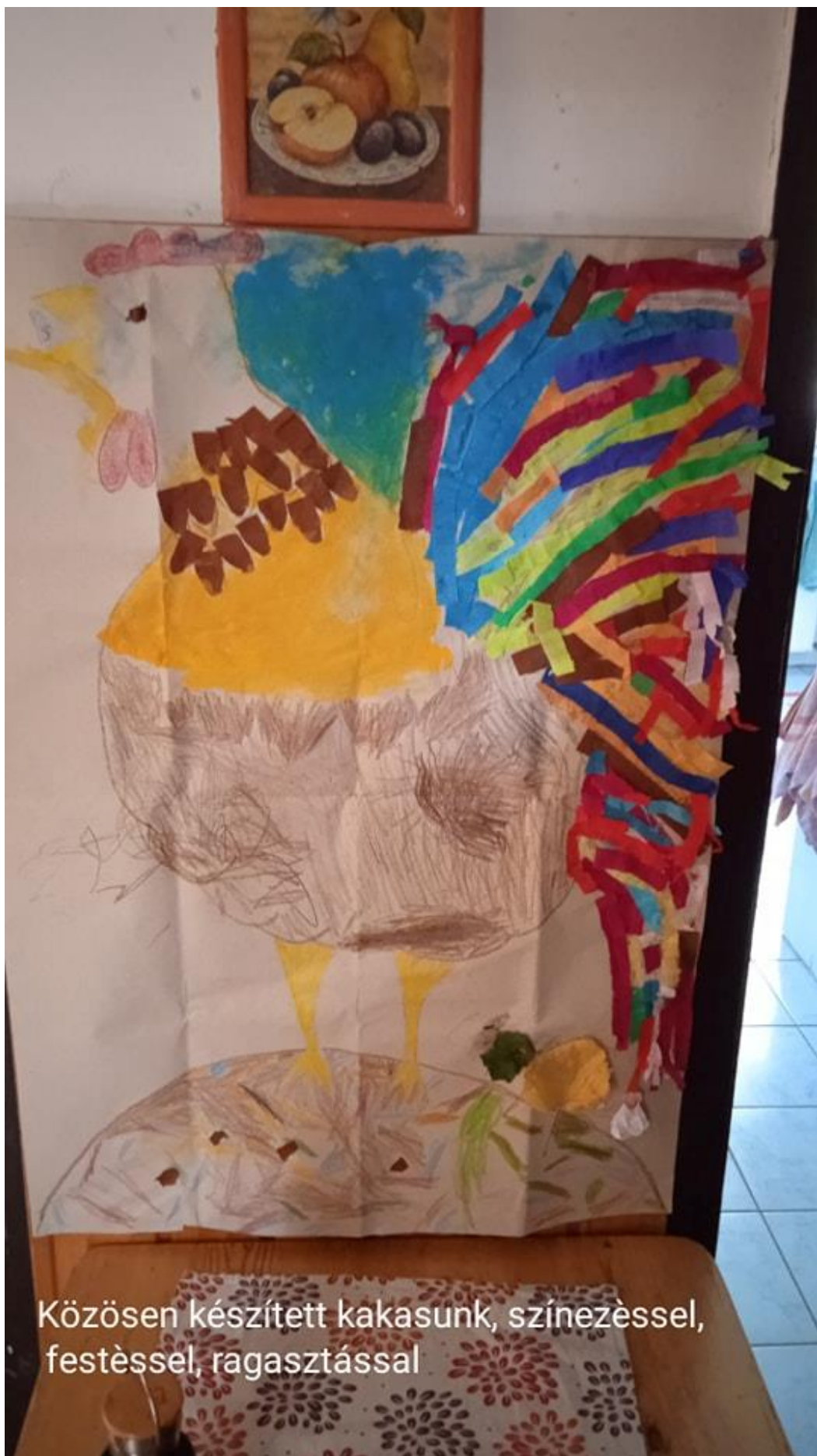
Közösen készített kakasunk, színezéssel, festéssel, ragasztással