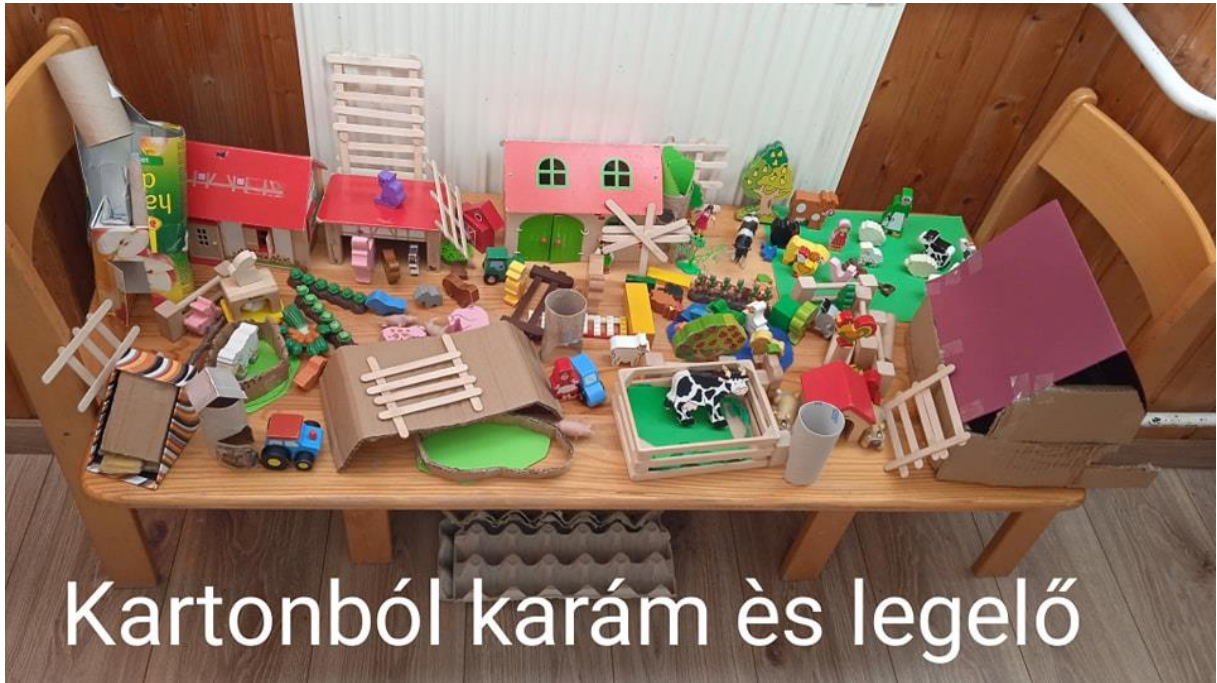
Kartonból karám és legelő